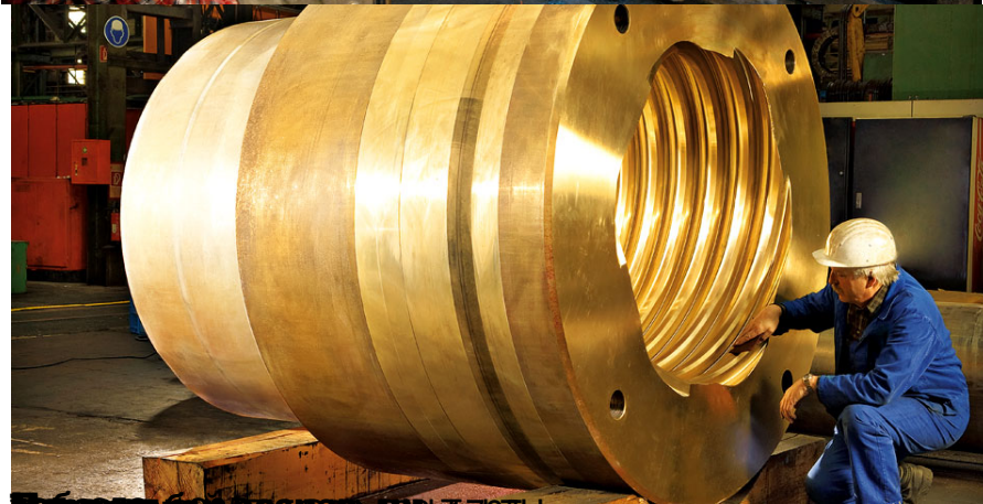
Изготовление шпindelной гайки изменения вылета стрелы портального крана «Марabu» GZ-CuSn10 2.1050.03 DIN 1705