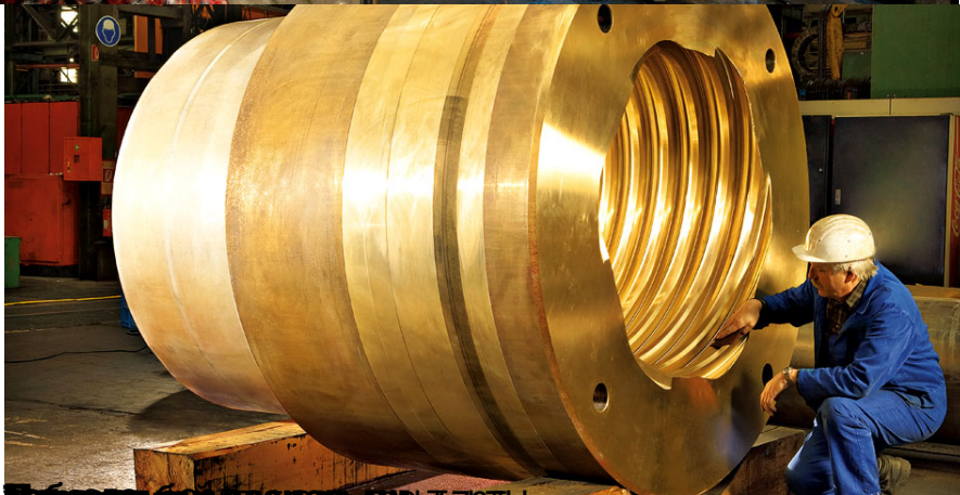
Изготовление шпindelной гайки изменения вылета стрелы портального крана «Марабу» GZ-CuSn10 2.1050.03 DIN 1705