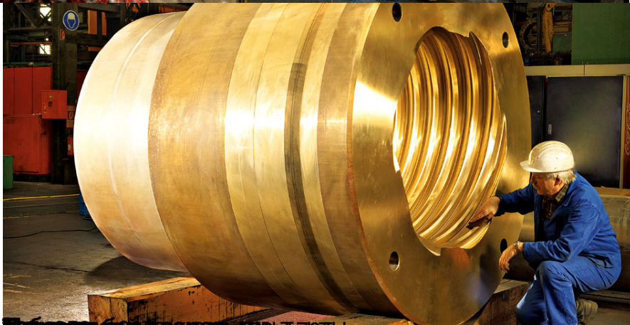
Изготовление шпindelной гайки изменения вылета стрелы портального крана «Марabu» GZ-CuSn10 2.1050.03 DIN 1705