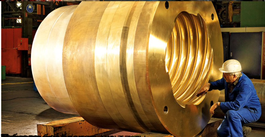
Изготовление шпindelной гайки изменения вылета стрелы портального крана «Марabu» (заготовки)