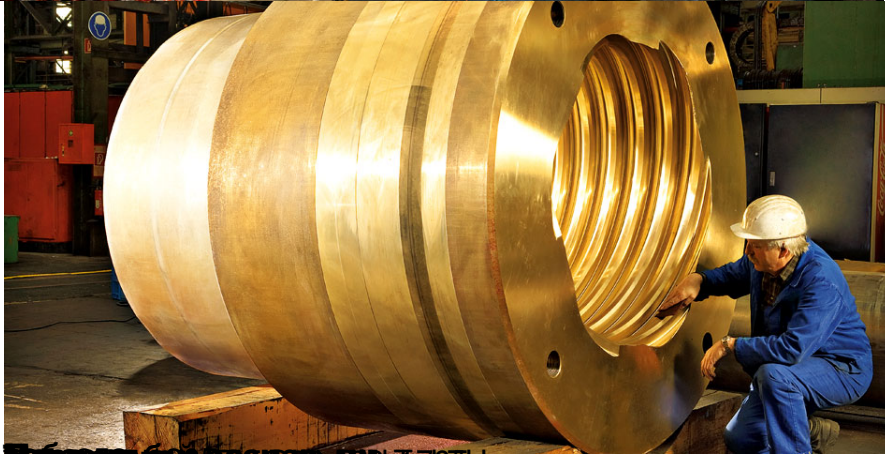
Изготовление шпindelной гайки изменения вылета стрелы портального крана «Марabu» GZ-CuSn10 2.1050.03 DIN 1705