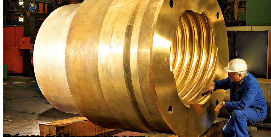
Изготовление шпindelной гайки изменения вылета стрелы портального крана «Марабу» GZ-CuSn10 2.1050.03 DIN 1705