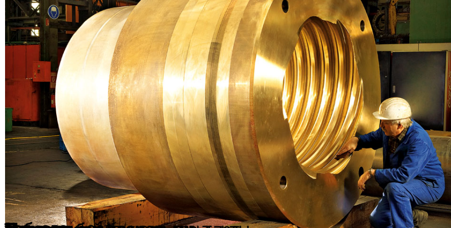
Изготовление шпindelной гайки изменения вылета стрелы портального крана «Марabu» GZ-CuSn10 2.1050.03 DIN 1705